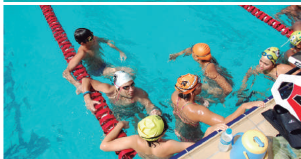
Iniciação esportiva é um dos princípios da Piscina