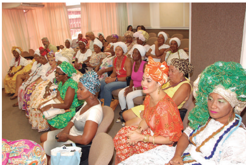
Profissionais do tabuleiro integram a Classificação Brasileira de Ocupação

Durante a solenidade de certificação, uma boa notícia para a categoria: Ministério do Trabalho e Emprego (MTE) vai colocar o ofício das baianas de acarajé na Classificação Brasileira de Ocupações (CBO).