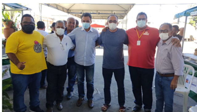
Fig. 1 - Autoridades presentes na Feira de Economia Solidária de Remanso