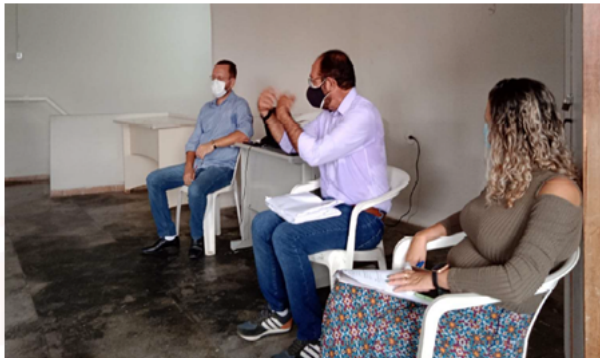
Fig. 2 - Reunião do Conselho Municipal de Desenvolvimento Sustentável – CMDS

Diante do exposto, a Contratada cumpre com o componente finalístico em questão.