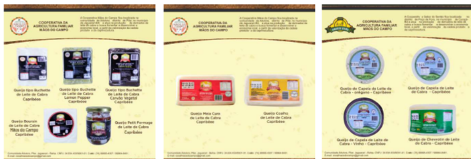
Figura – Catálogo dos produtos

Expõe os gargalos enfrentados na logística, dentro e fora do território, na entrega dos produtos nos mercados convencionais para comercialização por falta de um veículo apropriado, principalmente no que tange a produtos refrigerados, limitando assim o aumento no volume de pedidos. Todos os trimestres o catálogo utilizado para apresentar produtos aos estabelecimentos é atualizado com a inserção de novos produtos. Este trimestre foram adicionados mel e queijos maturados.