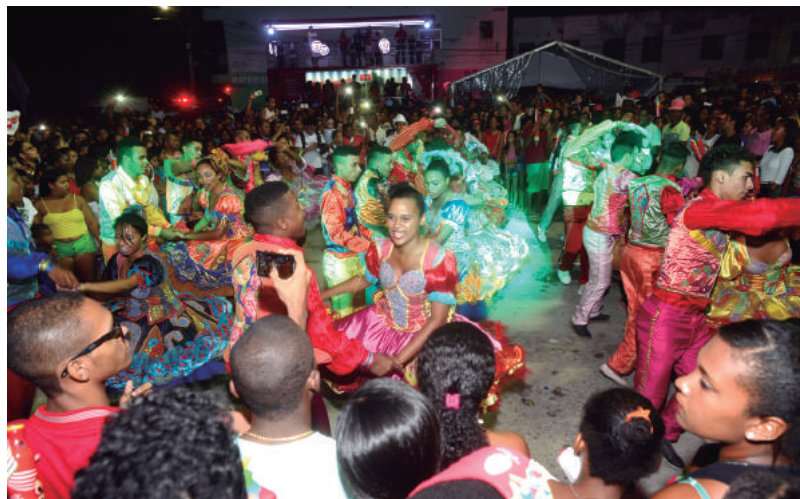
As manifestações da cultura local ajudaram na celebração da festa

no município de Juazeiro, João Gilberto, o filho mais ilustre da cidade, foi homenageado. Clássicos da bossa nova, muitos