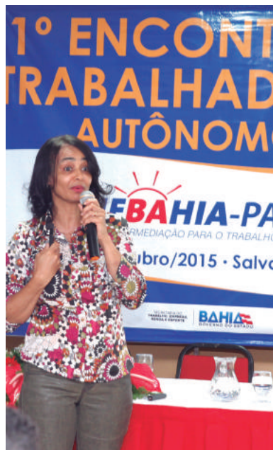
Novo Portal Patra vai aquecer a geração de emprego e renda na Bahia

Intenção é transformar o Patra num sistema modelo e referência, assim como hoje é o SineBahia dentro e fora do País. O novo Patra terá uma concepção de rede social com os usuários dando notas aos serviços. Atualmente 800 profissionais autônomos (pintor, piscineiro, faxineira,