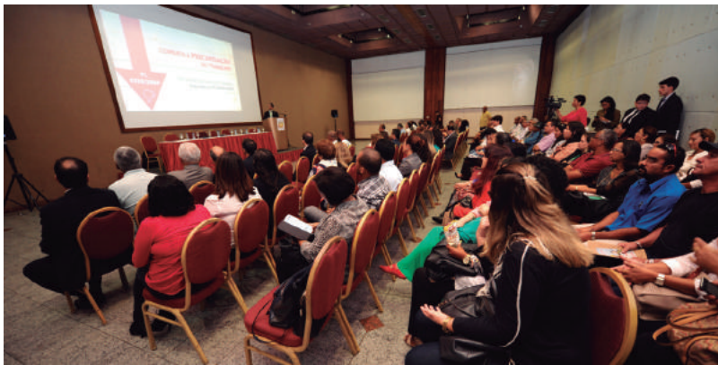
O Projeto de Lei da Câmara – PLC 30/2015, em tramitação no Senado Federal, deve ser votado até o final do ano.

Atualmente, a Súmula 331 do Tribunal Superior do Trabalho (TST), que rege a terceirização no Brasil, proíbe a contratação para atividades-fim das empresas.