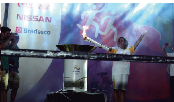
Chama Olímpica enfrentou situações as mais diversas nos 27 municípios baianos em que percorreu