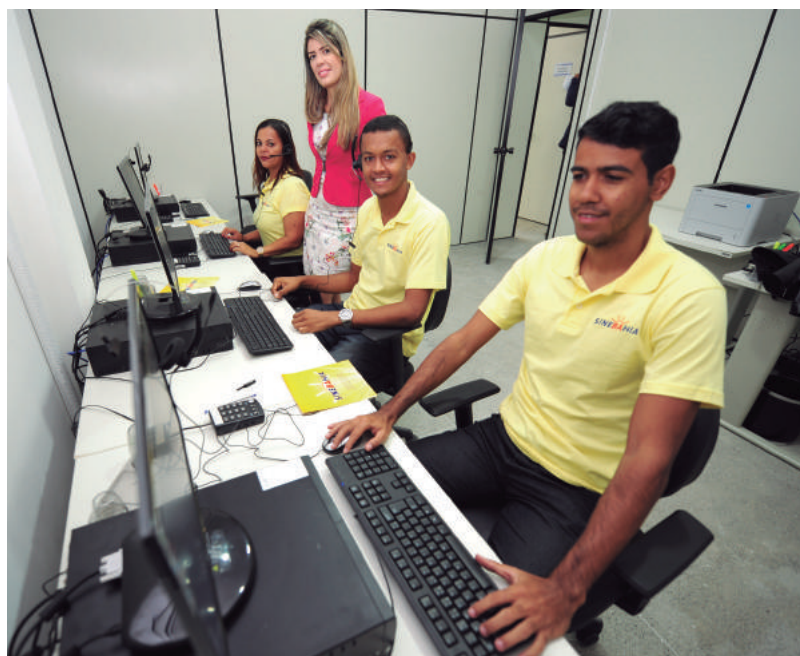
Unidade Modelo aqueceu a economia de Itabuna

Unidade grapiúna significou um investimento da ordem de