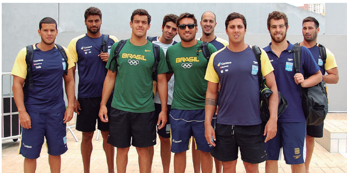
Polo Aquático Olímpico do Brasil encerrou aclimação em Salvador com amistoso ante selecionado brasileiro da modalidade

Já a plural equipe do Polo Aquático, formada por atletas de várias cidadanias, saiu de Salvador com esperança de elevar a posição do Brasil no quadro de medalhas das Olimpíadas.