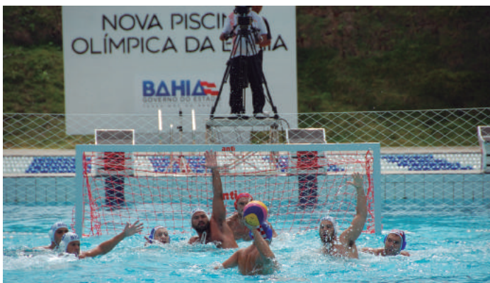
Atuais campeões olímpicos, croatas do polo aquático também adicionaram dendê baiano na preparação rumo ao bi