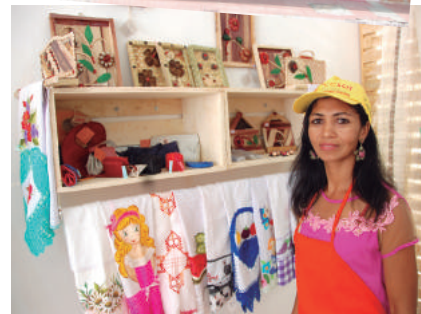
Espaço beneficia 150 empreendimentos