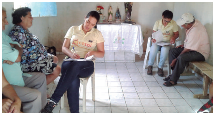
Iniciativa busca assessorar trabalho dos empreendimentos solidários

Para identificar e acompanhar Empreendimentos Econômicos Solidários (EES), técnicos dos Centros Públicos de Economia Solidária, distribuídos pelo Estado, realizam visitas periódicas a esses empreendimentos.