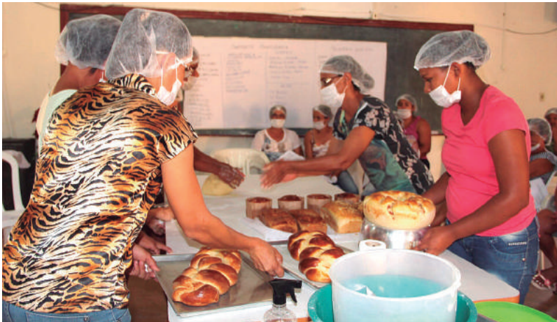
Cesols oferecem capacitação e assessoramento e empreendimentos

Implantados pela Setre, onze Centros Públicos estão em operação sob a responsabilidade de Organizações Sociais (OS) selecionadas por editais realizados pela Setre.