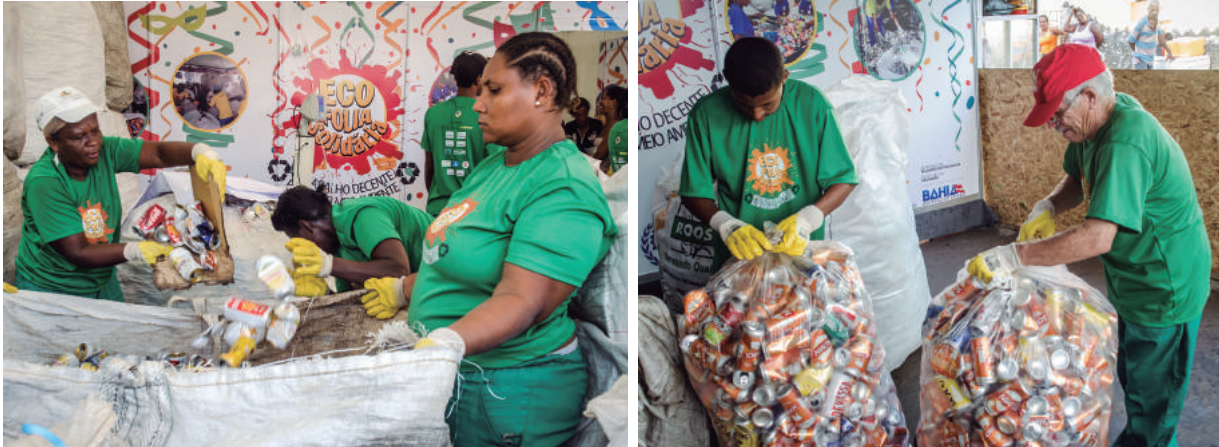
Iniciativa traz visibilidade e renda ao catador de resíduos sólidos

Mais de 90 toneladas de resíduos sólidos - descartados no Carnaval 2016 em Salvador - foram coletadas pelos catadores. A Setre investiu R$ 1,1 milhão no apoio aos projetos 'EcoFolia Solidária - O Trabalho Decente Preserva o Meio Ambiente' e 'Cata Bahia'.