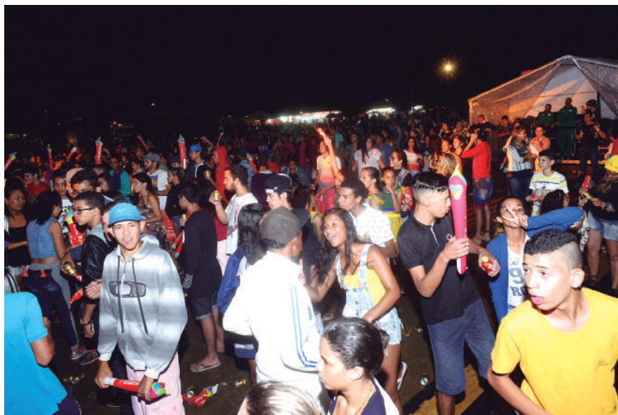
Em Senhor do Bonfim, a população festejou bastante o inédito contato com o símbolo dos jogos

“É um privilégio viver um momento como este aqui em nossa cidade. E mais ainda, ver este símbolo mundial passar na porta de nossa casa. Minhas filhas estão encantadas”, contou a animada mamãe.