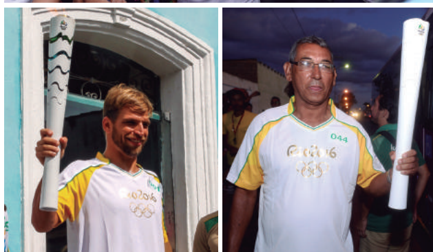
Esportistas e população local conduzem a tocha