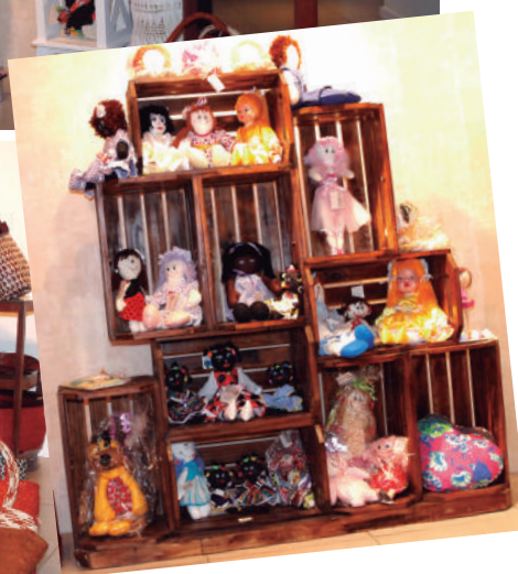
Grandes shoppings de Salvador descobriram a viabilidade comercial com selo solidário