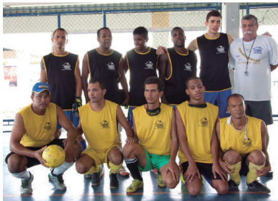
Três jogadores do time foram convocados para a Seleção Paralímpica

O time de Futebol de 5 do Instituto de Cegos da Bahia conquistou o tricampeonato mundial na República Tcheca. Os paratletas são, atualmente, hexacampeões brasileiros e tetracampeões do Nordeste. Todas as conquistas em sequência. No Campeonato Mundial, o time baiano marcou 29 gols e não sofreu nenhum. Inte-