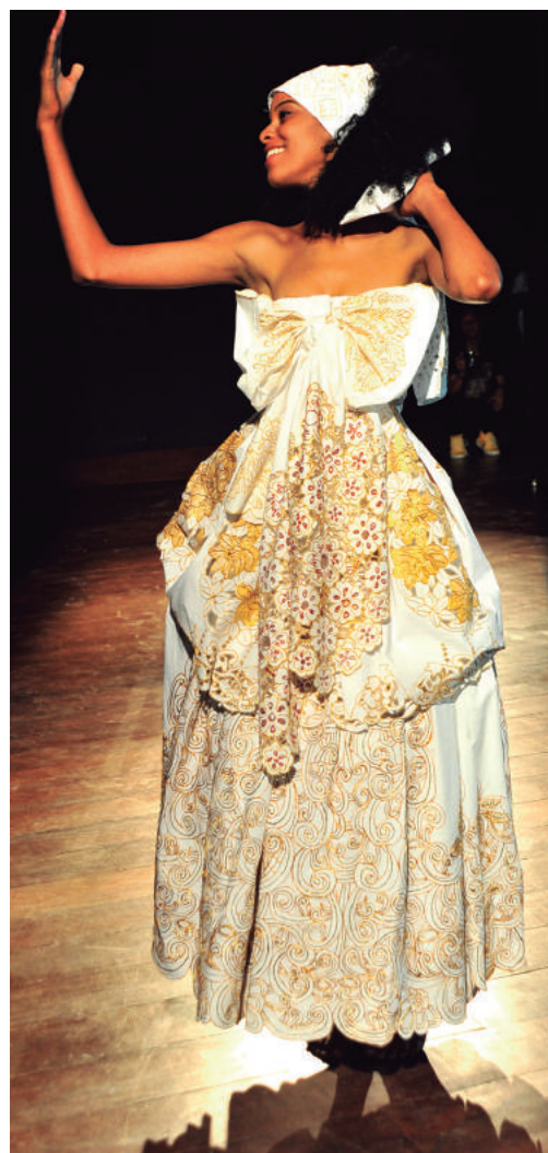
Richilieu é fonte de renda para concluintes do curso