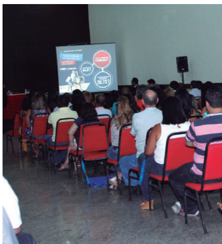
Premiação busca valorizar municípios que estimulam a prática do comércio justo e solidário

Vinte e sete cidades receberam o Prêmio Paul Singer - que valoriza os municípios de melhor performance no atendimento pelo Credi-Bahia - Programa de Microcrédito do Estado da Bahia. O evento contou com a participação de 35 prefeitos.