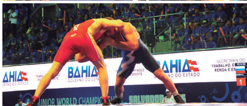
Campeonato Mundial Júnior de Wrestling reuniu atletas de 62 países