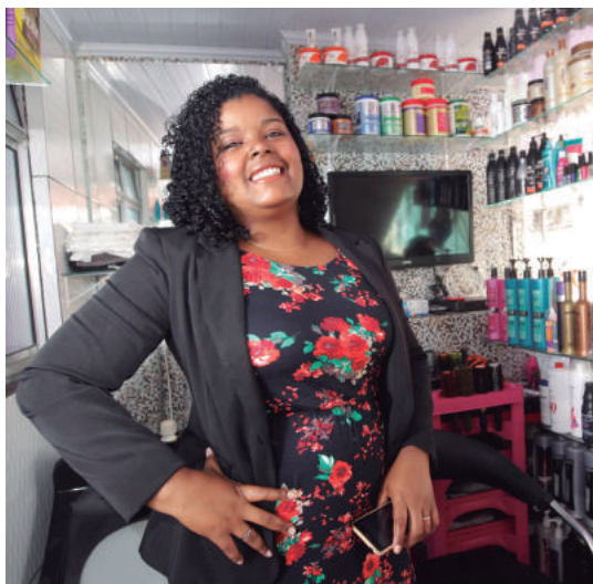
Programa de Microcrédito fortalece economia local

Foram beneficiados pelo programa 8.546 em-