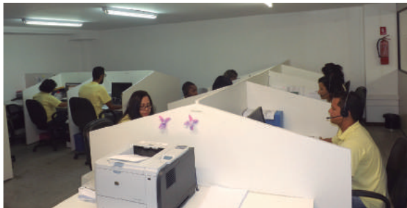
O trabalho conjunto com empresas acalera a reinserção no mercado de trabalho

Mais de 2,3mil empresas firmaram parceria com o SineBahia no ano passado. O trabalho executado no período de janeiro a dezembro resultou em mais de 79 mil vagas ofertadas em todo o estado, sendo 30 mil na capital. Foram