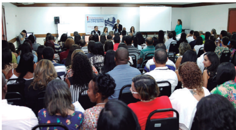
Iniciativa serviu para alinhar operação do novo sistema de emissão da CTPS

Novo sistema permite que a emissão seja feita on line, embora não altere o documento final. Outra vantagem é a integração