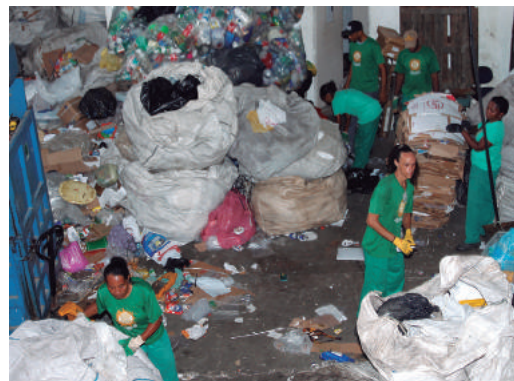
Financiamento incrementa trabalho das cooperativas no Carnaval

CrediBahia e CrediSol. Com o empréstimo, foi possível comprar o material coletado pelos catadores avulsos; estocar e só vender após o período da festa, quando o valor das latinhas e garrafas PET aumenta.