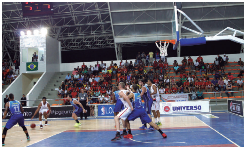
Ginásio se consolida como palco de grandes competições