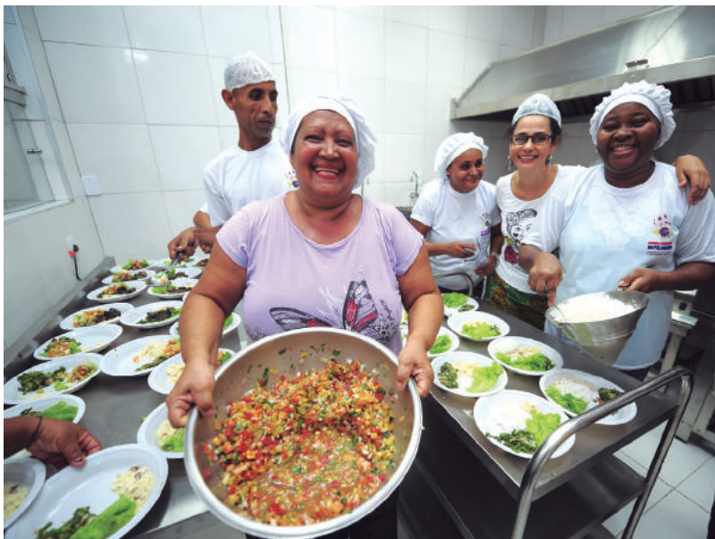
Equipamento beneficia mais de 360 famílias do Sítio Histórico de Salvador

Funcionando em um imóvel, na Rua da Oração, 24, a Cozinha Comunitária opera com equipamentos modernos e equipe capacitada em gastronomia. O empreendimento é um exemplo de que a economia solidária é um fator de inclusão social e redução das desigualdades sociais.