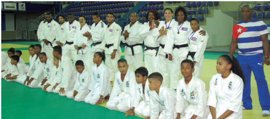
Os ares da Bahia fizeram parte da preparação dos cubanos do judô, taekwondo e halterofilismo para a Rio 2016

Como preparação para a Rio 2016, os croatas realizaram um amistoso com a Seleção Brasileira na Piscina Olímpica, quando venceram por 7 a 2.