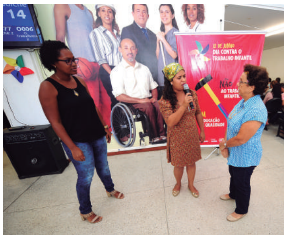
O 12 de junho e celebrado com muita luta pela erradicação dessa mazela social

A semana aconteceu entre os dias 08 e 12 de Junho, em parceria com o Fórum de Erradicação do Trabalho Infantil e Proteção do Trabalho Adolescente (Fetipa).