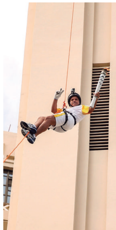
Rapel no Elevador Lacerda

E a adrenalina não parou por aí. Sabiá passou a chama olímpi-