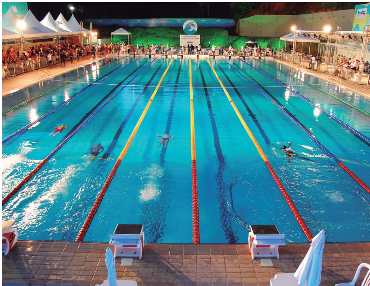
Piscina olímpica da Bahia é considerada uma das melhores do Brasil

Com proposta de revelar futuros talentos para a natação brasileira e atender atletas de alto rendimento, foi entregue pelo Governo do Estado, no final de março, a Nova Piscina Olímpica da Bahia.