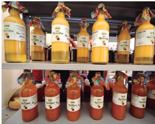
Escoamento da produção favorece segmento

São oferecidos os serviços: estudo de viabilidade