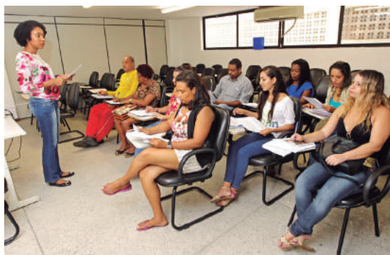
Cursos e palestras capacitam os trabalhadores

Deve comparecer portando Carteira de Trabalho e Previdência Social (CTPS) com o número do Programa de Integração Social (PIS). As demais palestras são abertas a todos os trabalhadores sem restrição de idade ou grau de escolaridade. Interessados precisam comparecer à unidade no dia e horário correspondes à atividade desejada.