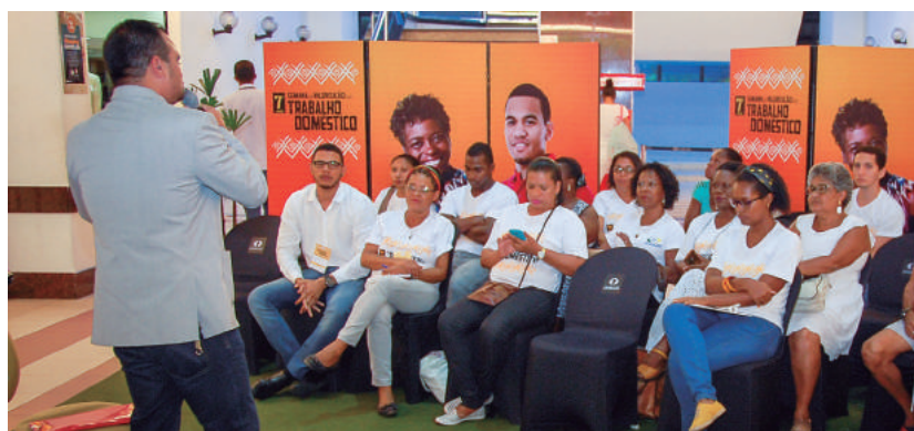
Serviços e palestras são ações da Semana de Valorização do Trabalho Doméstico