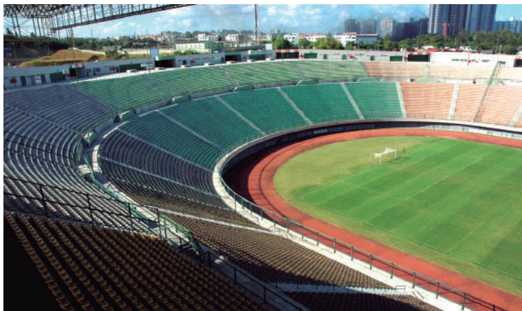
Estádio é administrado pela Superintendência de Desportos do Estado Bahia – SudeSB

Há dois anos o equipamento esportivo abriu as portas para o esporte de base e amador, além de sediar algumas partidas da Copa do Brasil, Campeonato Brasileiro, Copa 2 de Julho, Copa Metropolitana, Copa Salvador Cup, dentre outras.