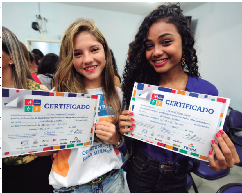
Trilha promove qualificação de jovens

Durante a capacitação receberam bolsa-auxílio mensal no valor de R$ 100. O Programa Trilha contempla jovens, com idade entre 16 e 29 anos, cadastrados no programa Bolsa Família, do Governo Federal.