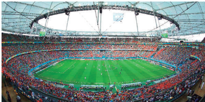
Arena fonte Nova será palco do jogo Brasil x Dinamarca

A lista com os nomes dos 18 jogadores convocados para buscar