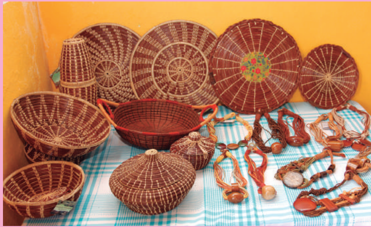
Biojóias são resultado da transformação da matéria-prima em arte

Transformar a palha da piaçava e o coco em colares e pulseiras – chamadas biojóias –, mandalas, cestos e vasilhames. As peças são resultado do Projeto Artes Associadas dos Quilombos, da Comunidade Quilombola de Jatimane, localizada no município de Nilo Peçanha, região Baixo-Sul do Estado. O projeto também desenvolve ações nas áreas de culinária, cultura, estética afro e desenvolvimento do turismo.