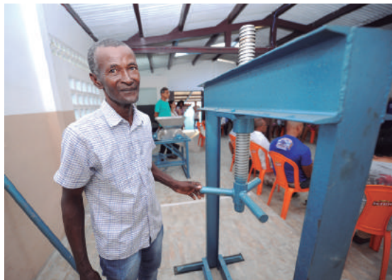
Comunidade resgata produção agrícola

Foram disponibilizados R$ 121 mil em recursos para o Centro Capoeira e Engenho. Cordoaria é uma comunidade remanescente quilombola, localizada a 16 km de Camaçari, no distrito de Vila de Abrantes. Com aproximadamente 260 anos de fundado, o