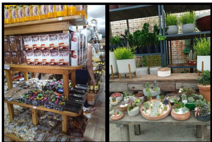
IMAGEM 2: INCLUSÃO EM MERCADO CONVENCIONAL DE PRODUTOS DOS EMPREENDIMENTOS: CACAU PORTO E GIRASSÓIS SUCULENTAS.