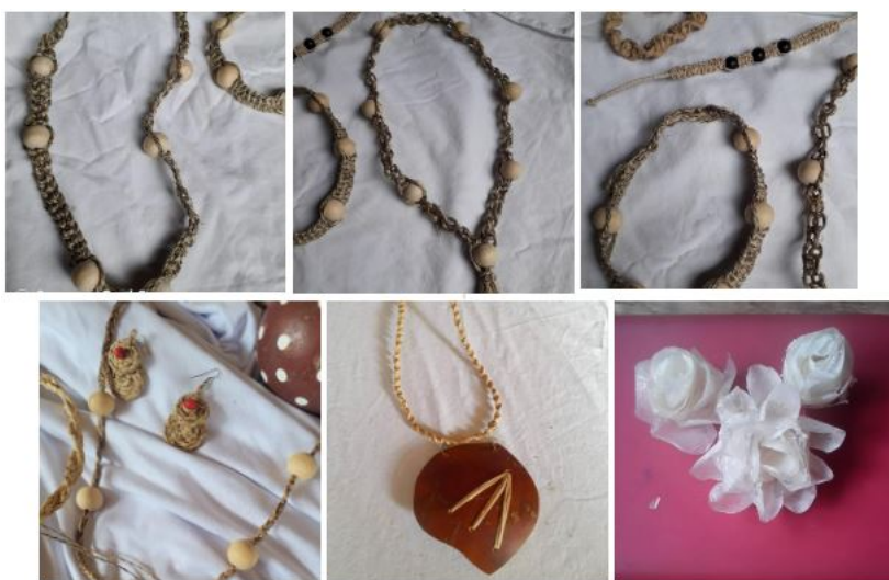
IMAGEM 6: PRODUTOS DESENVOLVIDOS DURANTE O 6º TRIMESTRE.

O documento encaminhado pela OS apresenta um levantamento de trabalhos na área de design sobre a intervenção na produção artesanal, além de resultados alcançados em bijóias, no trimestre: em colares, braceletes, pulseira e brincos, produtos confeccionados em fibra de bananeira e escama de peixe, matérias primas encontradas na comunidade Pataxó, que podem ser conferidas na imagem abaixo: