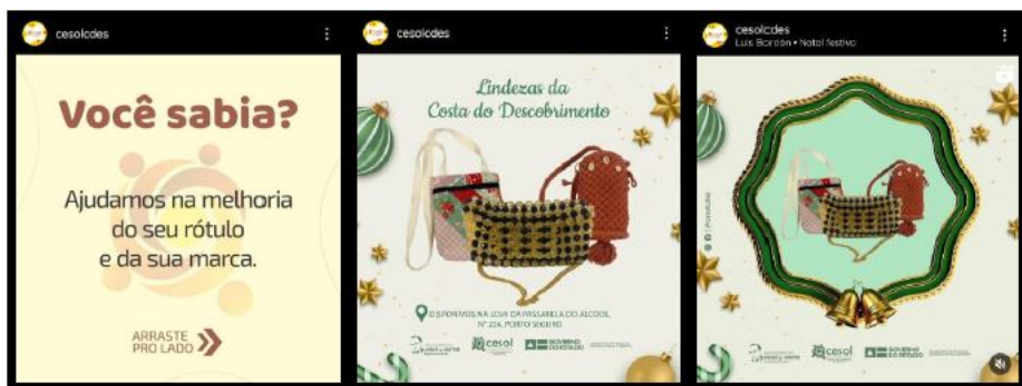
IMAGEM 3: CARDS WEB PUBLICADOS NO PERFIL DO CESOL CDES NA REDE SOCIAL INSTAGRAM, NO TRIMESTRE.

No trimestre em tela o Cesol CDES publicou 21 (vinte e um) cards em seu perfil na rede social Instagram (@cesolcdes), sendo 03 relacionados a datas comemorativas, 08 voltados à divulgação de produtos, 05 voltados à promoção de eventos realizados pelo Cesol, 03 informativos e 02 voltados à divulgação de atividades realizadas durante visitas técnicas.