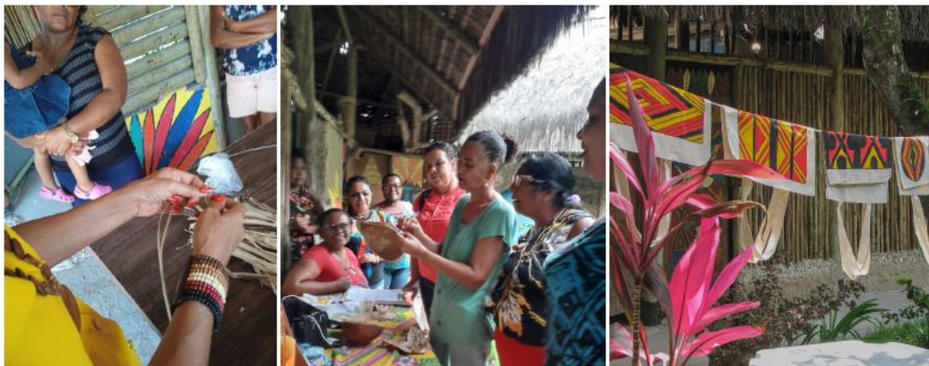
IMAGEM 5: FOTOS DAS OFICINAS REALIZADAS POR ISA BAHIA DURANTE O 6º TRIMESTRE.

Como pode ver verificado nas imagens abaixo apresentadas, um conjunto de tipologias que varia entre trançado de palha e pintura em tecido, vem sendo desenvolvido durante as oficinas: