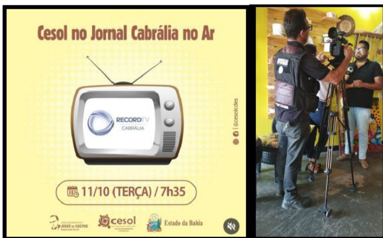
IMAGEM 4: CARD WEB DE DIVULGAÇÃO E FOTO DO MOMENTO EM QUE O COORDENADOR GERAL DO CESOL CDES CONCEDEU ENTREVISTA À TV CABRALIA.

A Comissão avalia como tendo sido cumprida a meta, já que a iniciativa, ainda que não seja um evento, foi veiculada na imprensa televisiva regional tendo grande repercussão de público, ampliando a visibilidade das questões relacionadas à sustentabilidade do meio ambiente local, que gera impacto nas vidas das pessoas, além da atuação do Cesol no território.